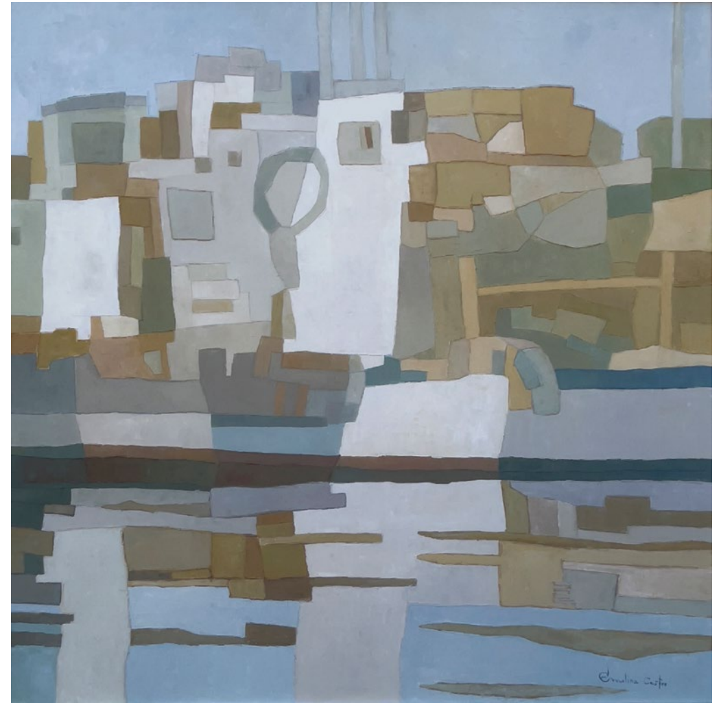
REFLEJOS • Técnica mixta sobre tabla • 2022 • 120 x 120 cm.

Una mujer, reducida a una sombra de oscuro ocre, parece buscar algo para comprar.