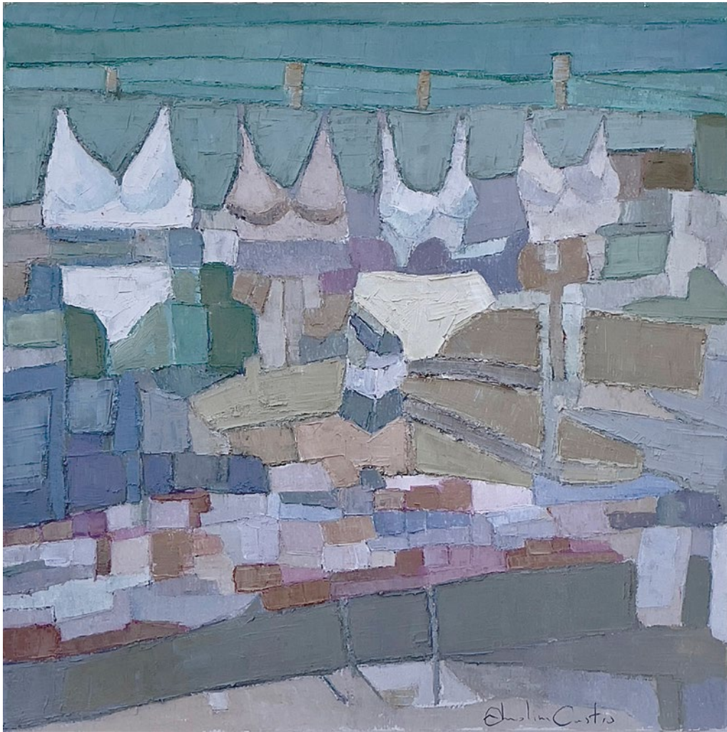
WONDERBRA • Técnica mixta sobre tabla • 2022 • 35 x 35 cm.

Aquí estamos bajo la sombra del toldo, más cerca de la mercancía -esta vez reconocible-, que no es otra que ropa interior femenina de diferentes tallas. Bajo esa ropa que cuelga, como reclamo de las compradoras, hay infinitud de pequeñas cajas, donde más ropa queda resguardada del tejemaneje de tantas manos.