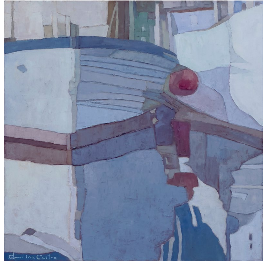
PROA • Técnica mixta sobre tabla • 2024 • 50 x 50 cm.

El barco atracado en el muelle es solo el comienzo y no sabe nada de nuestros pensamientos.