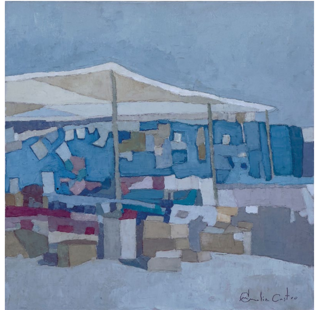
TODO BARATO • Técnica mixta sobre tabla • 2023 • 35 x 35 cm.

Una gran franja de ropa vaquera colgada destaca bajo el toldo de color ocre. Sus diversas tonalidades azules cruzan la composición de izquierda a derecha. Por debajo, ya en el suelo, muchas cajas de tonos tierra quedan visibles.