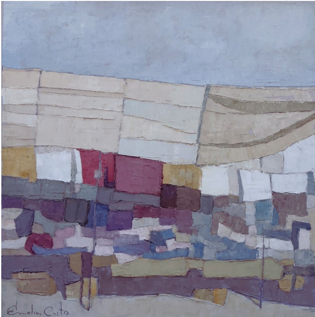
TIRAMOS LOS PRECIOS • Técnica mixta sobre tabla • 2024 • 35 x 35 cm.

Esta vez el toldo es de color ocre y parece remendado con retales de diferentes tonos. El cielo, el toldo, la ropa y el suelo ocupan toda la superficie en una composición absolutamente buscada en donde se manifiesta ese orden al que el artista es tan sensible.