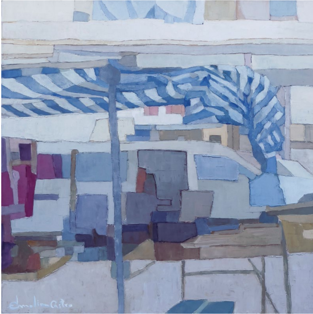
OTRO DÍA MÁS • Técnica mixta sobre tabla • 2023 • 50 x 50 cm.

Si bien en cada uno de los cuadros la realidad se representa en dos dimensiones, a veces, como en este caso, existe un elemento con el que la tridimensionalidad es patente.