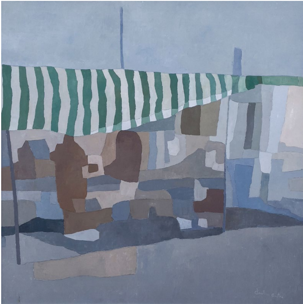
MERCADILLO • Técnica mixta sobre tabla • 2015 • 120 x 120 cm.

Este puesto ambulante de venta de ropa está representado al límite de la figuración.