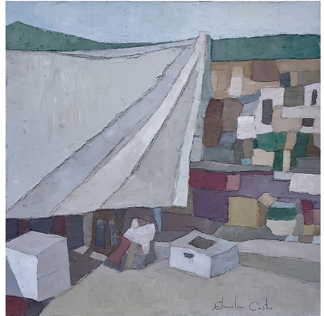
TIRAO DE PRECIOS • Técnica mixta sobre tabla • 2023 • 35 x 35 cm.

Todo está a la espera, el día no ha hecho sino comenzar.