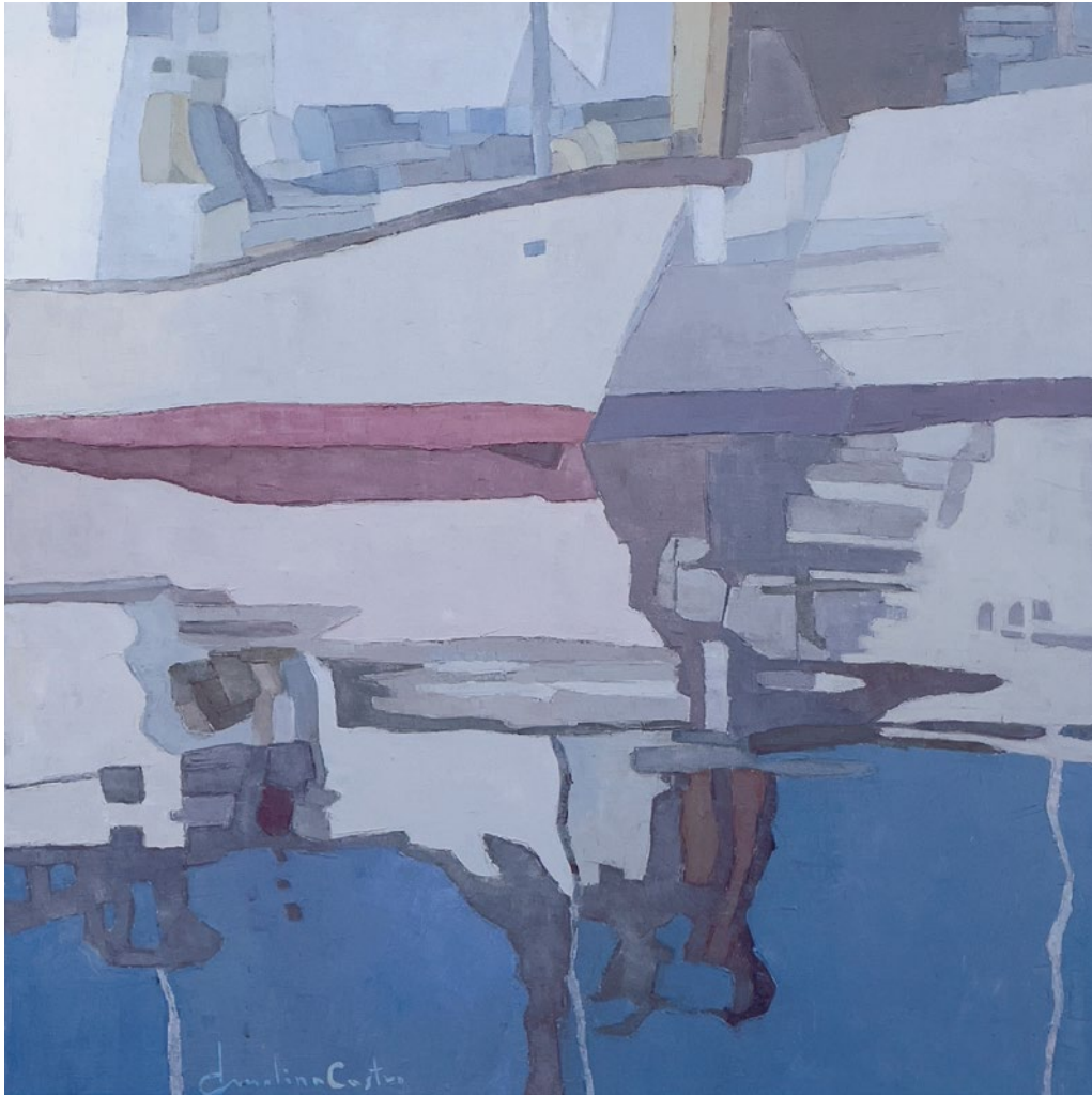
BANDA BABOR • Técnica mixta sobre tabla • 2024 • 50 x 50 cm.

Los reflejos son parte de la realidad, aunque gracias a ellos podemos inferir que la realidad es cambiante e interpretable. Ese es el juego que nos propone el pintor: que la realidad no es algo absoluto y que nuestra mirada, o nuestra no mirada, puede enriquecerla sin que exista límite en ello. La realidad se convierte así en el comienzo del acto creativo.