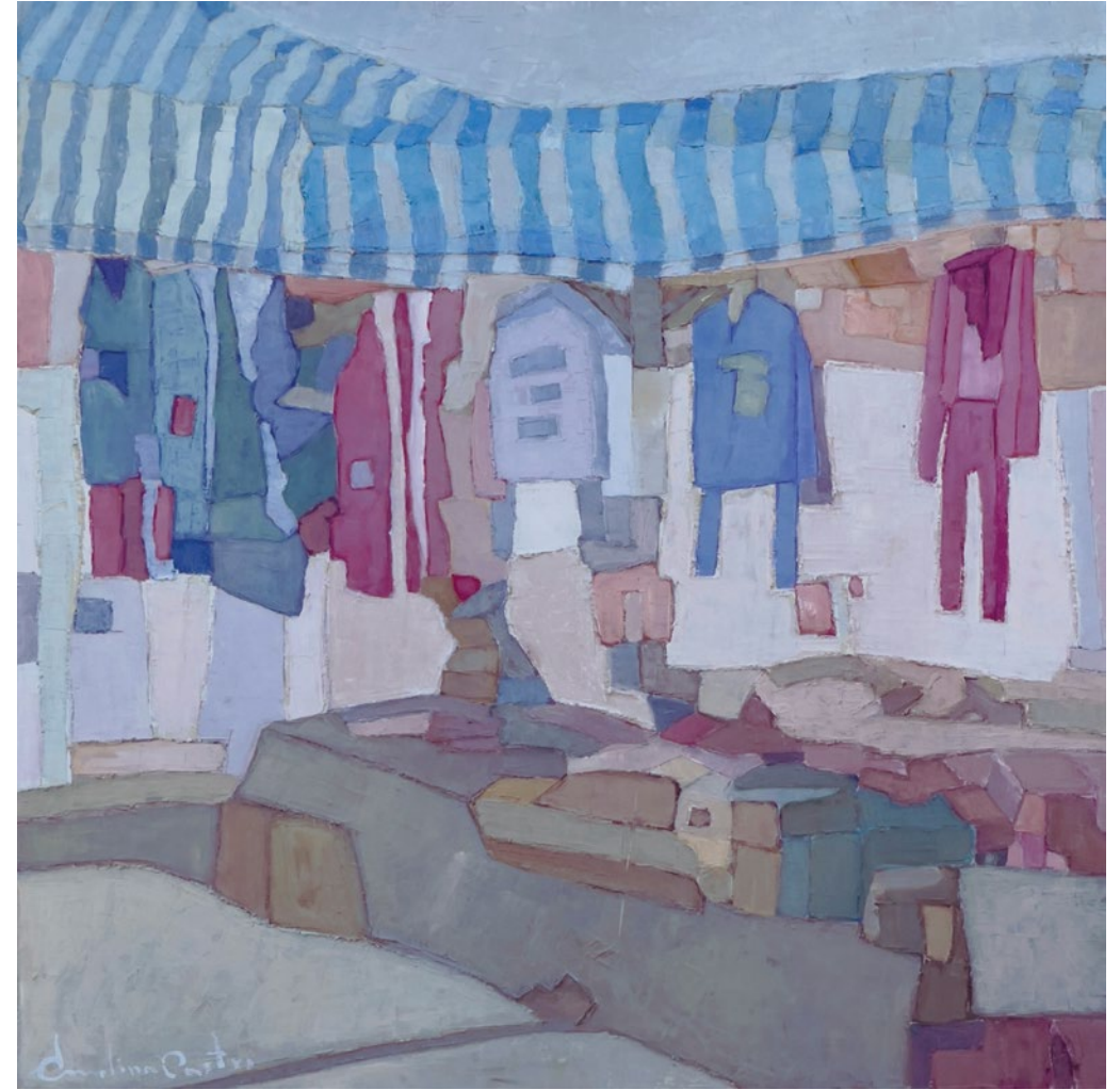
A MITAD DE PRECIO • Técnica mixta sobre tabla • 2024 • 50 x 50 cm.

Parece que hoy ha sido un día tranquilo.