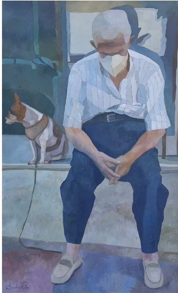
SONORA SOLEDAD • Técnica mixta sobre tabla • 2021 • 110 x 180 cm.

El retrato de este hombre con su perro no es el simple retrato del hombre, también es el retrato de su alma abatida y cansada.