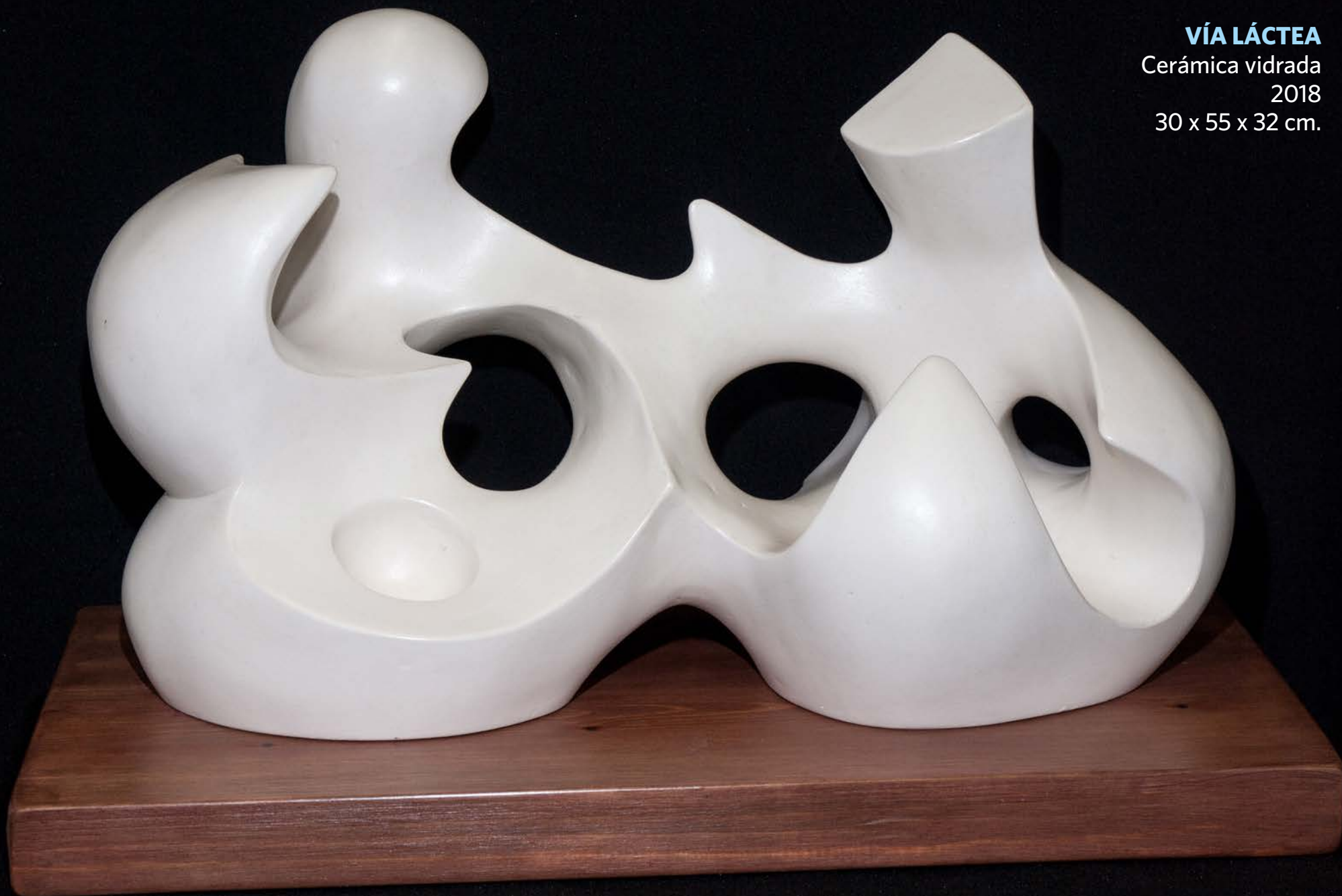
VÍA LÁCTEA Cerámica vidrada 2018 30 x 55 x 32 cm.