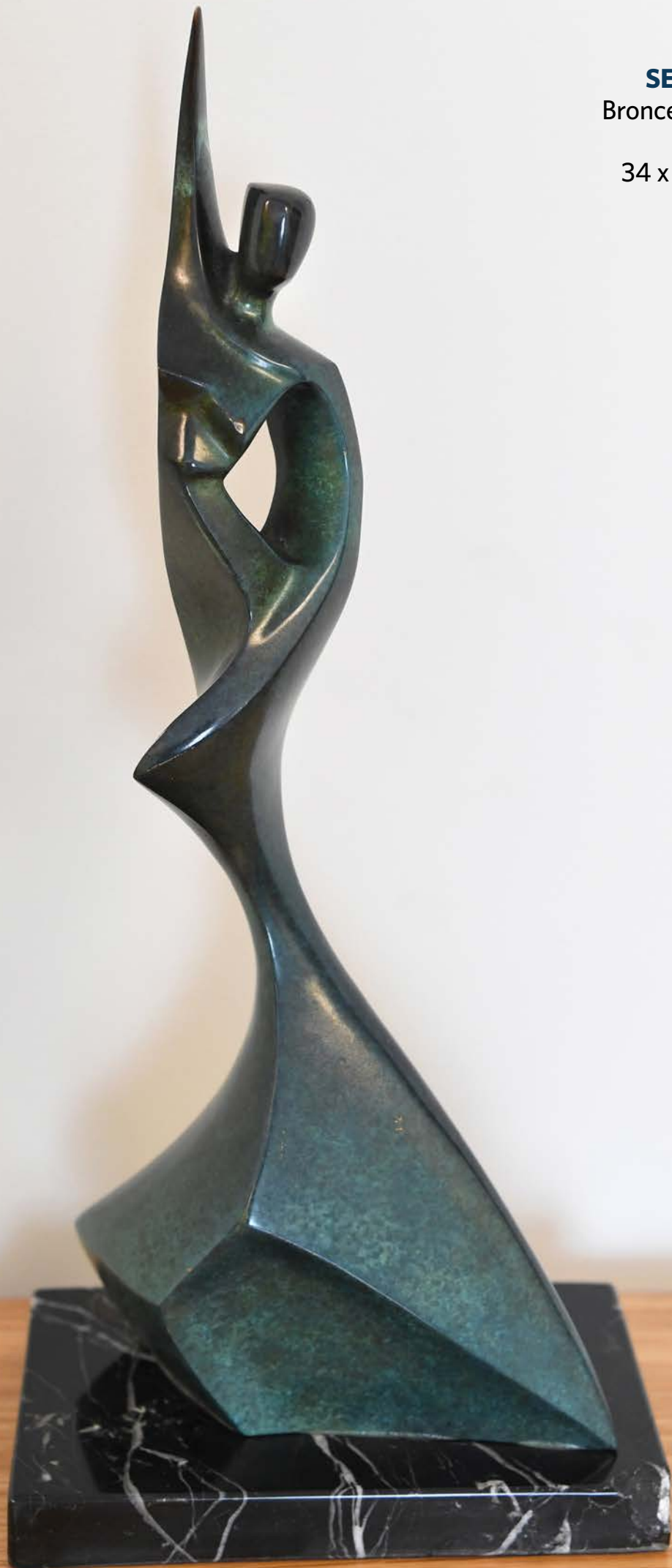
SEVILLANA Bronce patinado 1993 34 x 15 x 9 cm.